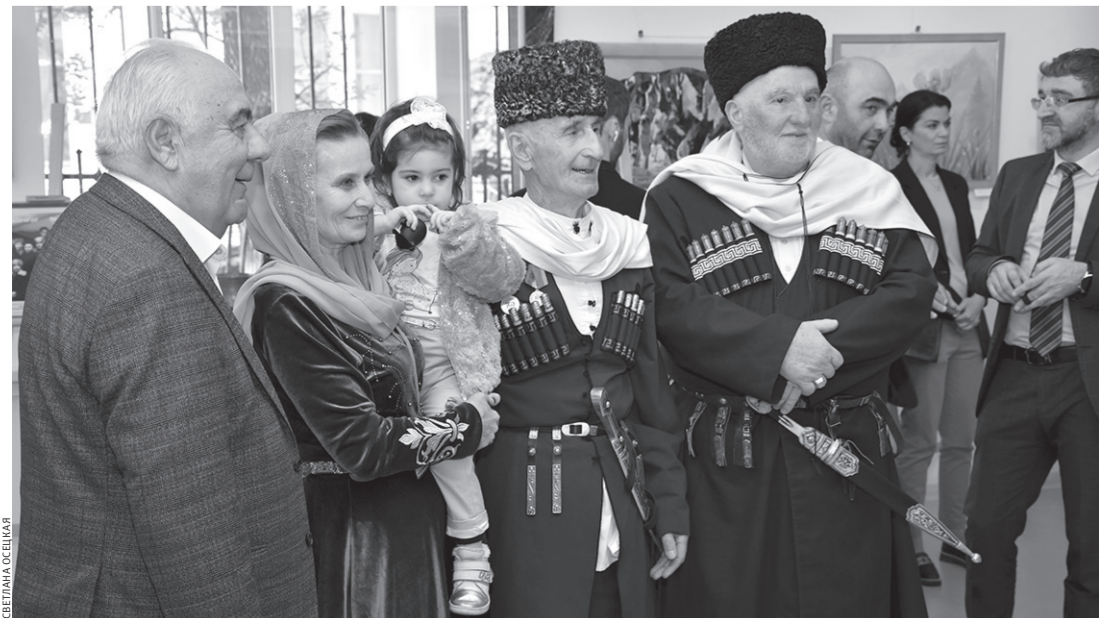
На выставке, посвященной Дню возрождения карачаевского народа

Хочу отметить и ту работу, которую наш профсоюз проводил в течение текущего года с руководителями муниципальных образований и работодателями, чтобы добиться прохождения обязательных периодических и предварительных медицинских осмотров работниками образовательных учреждений за счет средств работодателя. С. 2