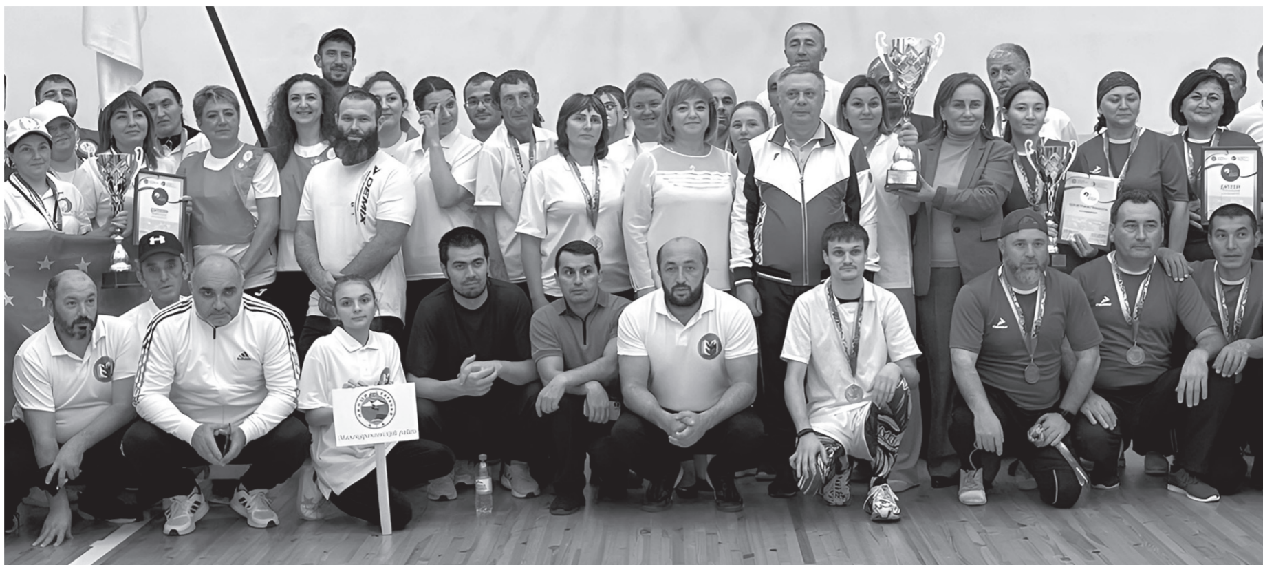
Участники профсоюзной спартакиады работников образования

В декабре 2023 года прошёл первый региональный конкурс профессионального мастерства между педагогическими парами наставников и наставляемых «Созвездие».