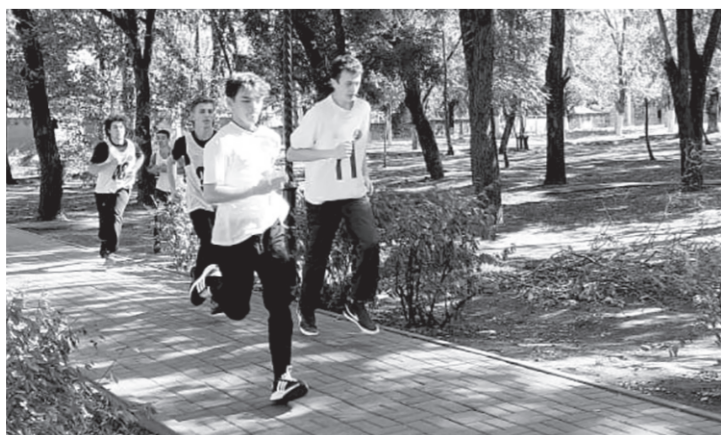
Забег студентов СКГА