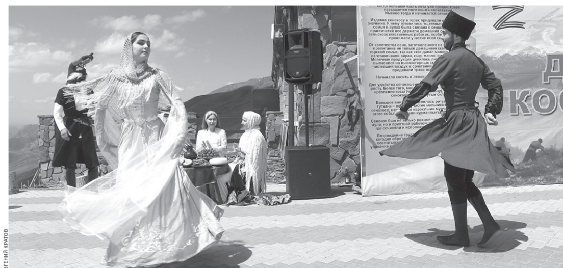
День косарей на перевале Гум-Баши

Особое стоит отметить встречи отделения «Къарачай Алан Халкъ» Малокарачаевского района с представителями терского казачества и совместное посещение исторических мест Карачая: мемориального комплекса жертв депортации в Карачаевске, древних карачаевских поселений Джамагат, Теберда, Домбай, аланских храмов IX—X веков.